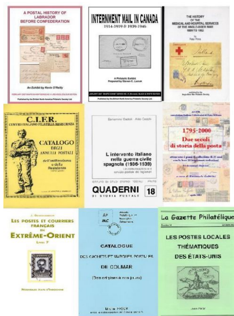
[Portadas de distintas publicaciones filatélicas extranjeras]